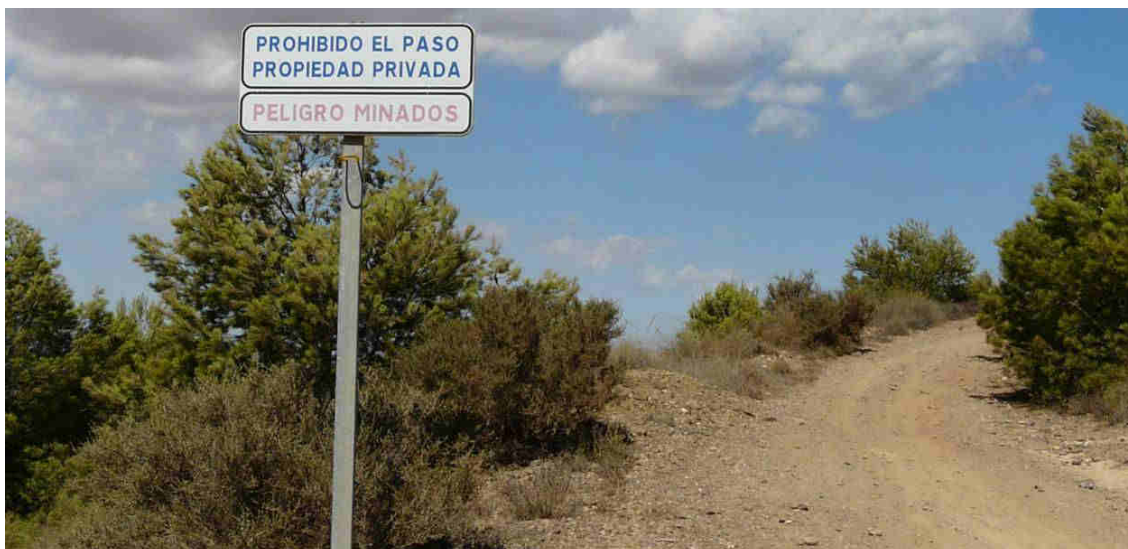
Ilustración 3. Señal prohibiendo el paso en el camino que conduce al Conjunto minero de Ponce