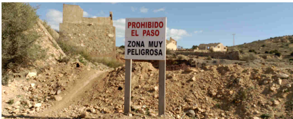
Ilustración 4. Cartel colocado por la propiedad en el Conjunto minero de La Parreta. 2019

Es sintomático del estado en que se encuentra el BIC de la Sierra Minera, que el único tipo de cartelería y señalización que existe en el mismo sean estos carteles prohibiendo el paso y advirtiendo del peligro, y que no haya ninguna señalización indicativa del carácter de BIC de los elementos. Las únicas excepciones en este sentido son la cartelería interpretativa colocada en el entorno de las Minas Las Matildes y Blanca, a raíz del Proyecto Jara, la que se colocó dentro del Parque Minero de La Unión, y la recientemente instalada, de carácter ambiental a raíz del Proyecto Life de conservación del Tetraclinis articulata .