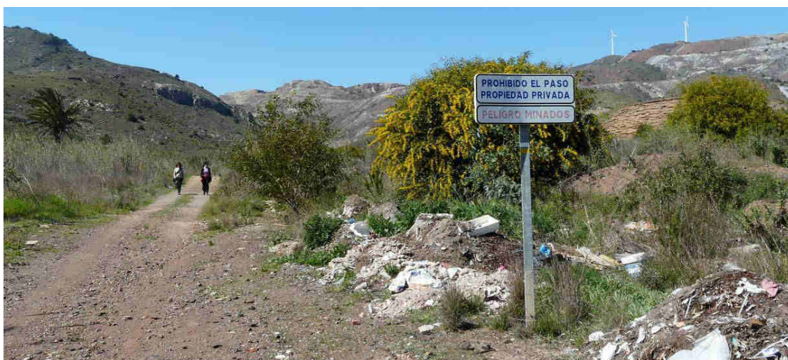
Ilustración 2. Señal prohibiendo el paso junto a vertidos de escombros en el inicio de la senda de la Carretera del 33 desde Portmán, que está señalizada como sendero de corto recorrido, en el mismo poste de la señal.

Otro aspecto a destacar son los impedimentos de los grandes propietarios al acceso y la visita al patrimonio minero de la zona. A pesar de que la calificación de BIC de la Sierra Minera obliga a los propietarios a permitir su visita pública (Art. 8.1, ley 4/2007, de 16 de marzo, de Patrimonio Cultural de la Región de Murcia), la actitud prevaleciente ha sido la de poner obstáculos para el acceso y la visita a diversos sectores del BIC. Por un lado, con carteles prohibiendo el paso por los caminos y accesos a los conjuntos mineros, aduciendo los riesgos y problemas de seguridad existentes, en vez de eliminar dichos riesgos (como es el caso de los pozos sin brocal o en mal estado). En el último año, ante la alarma generada a raíz del caso del niño fallecido tras la caída en un pozo, han proliferado más carteles de este tipo en otras zonas de la Sierra Minera.