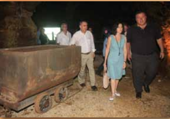
Visita ministra de Cultura

Para el 2011 esperamos que siga creciendo la afluencia de visitantes, puesto que ya hay confirmadas un elevado número de reservas de todo tipo de grupos de escolares, universitarios, asociaciones, o grupos de la tercera edad, y además, el Parque será punto de visita obligado para numerosos viajes y cruceros nacionales e internacionales. Todo ello debe permitir consolidar el Parque Minero y avanzar en una triple dirección: