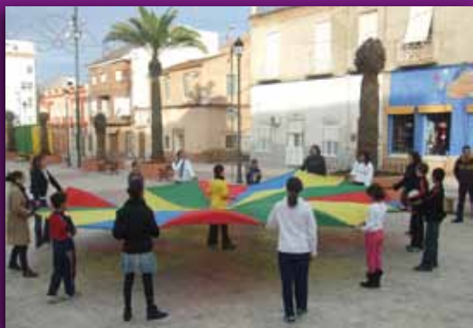
Tarde infantil en plaza Joaquín Costa

A lo largo de este año 2010 hemos logrado mantener el trabajo social con la población del Barrio San Gil, a pesar de las dificultades de financiación del programa, en un momento crucial para el barrio en el que siguen avanzando las obras de rehabilitación de las viviendas y el realojo de la población, que se están llevando a cabo en el marco del convenio firmado entre el Instituto de Vivienda y Suelo de la CARM, el Ayuntamiento de La Unión y la propia Fundación Sierra Minera.