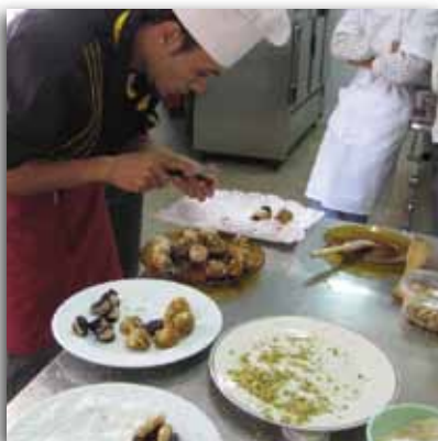
Curso de cocina

Para el curso 2010/11 solicitamos dos nuevos programas de cualificación profesional en los perfiles de auxiliares de cocina y restauración, pero sólo fue concedido el primero por la Consejería de Educación. Así pues, en octubre hemos comenzado un nuevo programa de cocina en el que tras sucesivas altas y bajas, contamos con 14 alumnos, en el que a diferencia de años anteriores, solo 3 son inmigrantes.