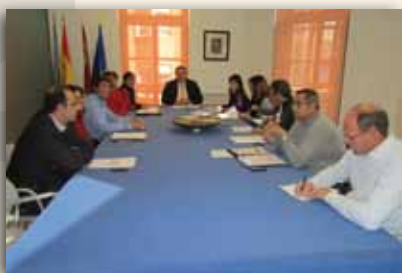
Reunión de la mesa

La Mesa de Empleo del Ayuntamiento de La Unión se constituyó en octubre de 2009 con todos los agentes implicados en empleo: Asociación de Empresarios, UGT, Comisiones Obreras, Cámara de Comercio, SEF, partidos políticos, Agencia de Desarrollo Local de Empleo, Murcia Acoge y Fundación Sierra Minera. Durante el 2010 se ha continuado el trabajo iniciado en el 2009. Las diferentes reuniones mantenidas han estado encaminadas en buscar y proponer soluciones conjuntas para paliar la crisis que de forma tan grave está afectando al Municipio