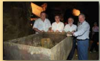
Inauguración del Parque