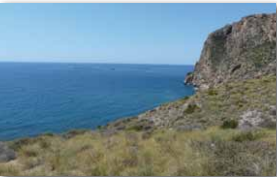
Cola de Caballo

ción de una obra portuaria de esta magnitud implicaría un impacto ambiental muy negativo , por lo que requiere consideración especial conforme a lo dispuesto en los artículos 6 o 7 de la directiva 92/43/CEE y su transposición a la legislación española.