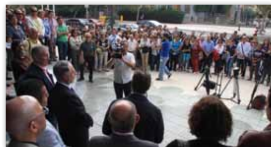
Participantes en la concentración en la Asamblea