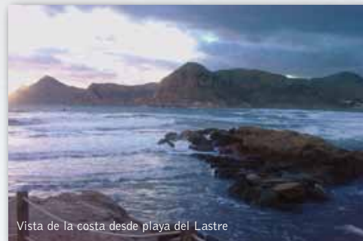
Vista de la costa desde playa del Lastré

En el documento de inicio de EAE se llega a sostener que el impacto paisajístico no será un problema pues la Cala del Gorguel sólo se observa desde el mar, por lo cual "los impactos sobre el paisaje sólo van a afectar a la cuenca visual que tiene su origen en el medio marino, mientras que desde la superficie no son apreciables las alteraciones del paisaje y antropización del mismo" (pág. 37). Pero, aunque esta cala se vea desde la carretera de acceso de La Unión a Portmán con una cierta dificultad, basta hacer una simulación paisajística de la dársena (mucho más grande y accesible visualmente que la bahía original), para ver que ésta se percibirá desde los accesos citados pero sobre todo desde la bahía de Portmán y su entorno más próximo, con lo que afectará gravemente al escenario visual de todo el segmento costero que rodea a estas localidades. Así, la construcción de esta gran dársena de contenedores en El Gorguel tendría un elevado impacto paisajístico en el litoral de esta zona , rompiendo radicalmente la imagen de singular belleza de la costa acantilada del litoral de la Sierra de Cartagena-La Unión entre Portmán y el Cabo de Agua. Y supondría también una fuerte interferencia visual con la Bahía de Portmán , a pesar del cambio efectuado por la Autoridad Portuaria en la orientación de la bocana.