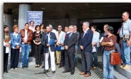
Lectura del comunicado en la Asamblea Regional