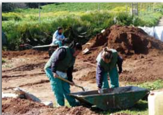
Curso de jardinería

✓ Un Curso de Jardinería y Viverismo en el que han participado 10 alumnos, de los cuales 7 eran población en riesgo de exclusión y 3 jóvenes inmigrantes. Destacar que un curso como éste en el que sólo participaban varones en ediciones anteriores, este año lo iniciaron y finalizaron 2 mujeres con unos resultados muy positivos.