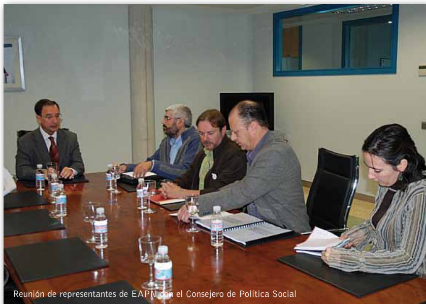
Reunión de representantes de EAPN con el Consejero de Política Social

El día 21 del pasado mes de noviembre, se celebró en el Mercado Público de La Unión el acto de conmemoración de los 40 años de Cruz Roja Juventud. Durante el acto, al que asistieron voluntarios de toda la Región y diversas autoridades, se premió a la Fundación Sierra Minera por la colaboración que ha prestado a la institución en la zona, y que ha permitido que ambas organizaciones podamos atender mejor a cada vez más personas.