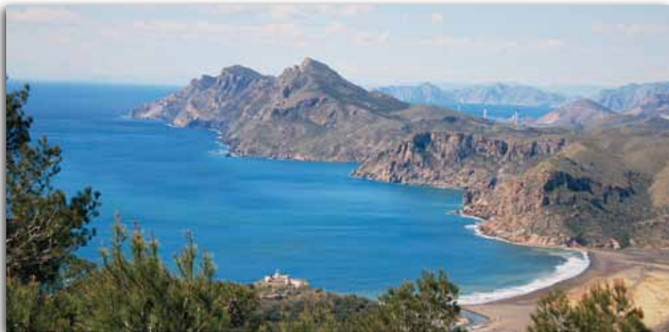
Impacto paisajístico: simulación realizada en el Informe elaborado por la Fundación

En definitiva, la instalación de esa gran infraestructura portuaria con sus instalaciones anexas, limitarían el desarrollo turístico de Portmán e impedirían las posibilidades de aprovechamiento turístico del entorno inmediato de la Cala del Gorguel, cala del Caballo, rambla del Avenque y valle del Gorguel, basado en su rico patrimonio natural, geológico y cultural.