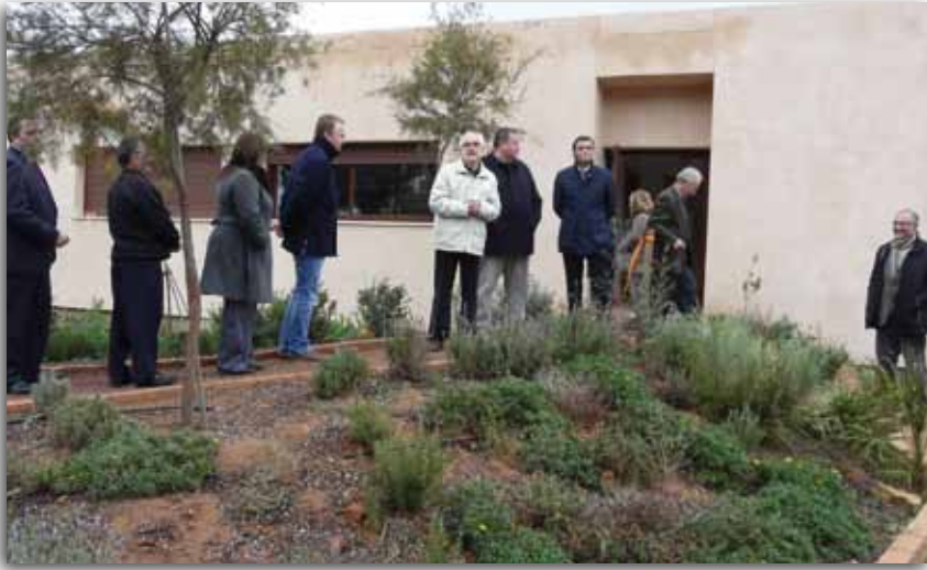
Inauguración del Aula

vivero, y ha quedado integrado en el entorno del parque ambiental. Se trata de un edificio sencillo con una superficie útil de 86,34 m 2 , que alberga una sala para el desarrollo de las actividades formativas y las dependencias anexas necesarias: vestíbulo, aseos y despacho. Las obras se han realizado por la empresa Restauralia-Cartago bajo la dirección del arquitecto Alberto Ibero y el arquitecto técnico Javier A. Domínguez, y posteriormente se ha adecuado el entorno mediante un curso de jardinería y viverismo. En definitiva, es una mejora importante para Huerto Pío, puesto que el aula permite consolidar, mejorar y ampliar la oferta formativa y de educación ambiental con escolares y con otros colectivos.