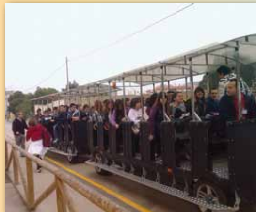
Escolares en el tren

Las visitas guiadas se adaptan a los diferentes tipos de grupos: desde escolares de primaria hasta universitarios, jubilados, colectivos y asociaciones diversas, turistas extranjeros, grupos especializados, discapacitados... Además, progresivamente se irá ampliando la oferta de actividades, preparando actividades didácticas específicas para escolares y otras actividades culturales complementarias. El extraordinario potencial didáctico del parque, también lo hace particularmente recomendable para visitas de prácticas de estudiantes de carreras universitarias, como Geológicas, Ingeniería de Minas, Ambientales, etc.