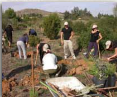
Taller voluntariado ambiental en Huerto Pío

Aunque el apoyo del programa VOLCAM ha terminado, la Fundación Sierra Minera continúa trabajando en estas tres líneas para consolidar y ampliar los resultados del proyecto, a través del mantenimiento del voluntariado, la implicación de la población y el mantenimiento y ampliación de la zona recuperada.