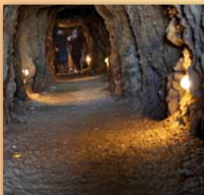
Entrada a la mina

Las visitas al Parque Minero permiten vivir una experiencia inolvidable de acercamiento al mundo de la minería de los siglos XIX y XX, a su proceso completo de extracción y producción, a las condiciones de trabajo de los mineros y al patrimonio que nos han legado. Las visitas guiadas tienen una duración global de 2 horas, e incluyen: