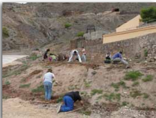
Repoblación forestal en el Parque Minero

Los tres objetivos se han desarrollado, y así se ha logrado constituir un grupo de voluntariado, se ha conseguido contactar con diversos colectivos, y se ha realizado una acción de recuperación que ha permitido incorporar flora autóctona a la cubierta vegetal de la zona, y ha revegetado aquellas zonas más deterioradas.