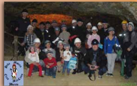
Visita de grupo

mentando la visita al Parque Minero con visitas a la Mina Las Matildes, el Parque Ambiental de Huerto Pío, o rutas guiadas por La Sierra Minera o La Unión. En los meses iniciales de verano, predominaron los visitantes individuales, mientras que posteriormente, en los meses de octubre a diciembre la tendencia ha cambiado, hasta alcanzar las visitas de grupos en noviembre un 77% del total de visitantes. Durante los días laborales fueron incrementándose sustancialmente las visitas de grupos de escolares, de estudiantes de secundaria y universitarios, de asociaciones y entidades diversas, y de jubilados, tanto al parque como para realizar paquetes combinados, mientras que los fines de semana y festivos han tenido un elevado grado de ocupación con visitas individuales y de carácter familiar.