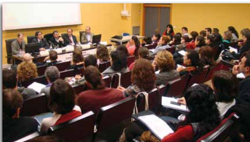
Mesa redonda en Seminario Estrategia Europea 2020

Las conclusiones se pueden consultar en la web: http://www.eapn.es/attachments/822_Para_Web.pdf . No obstante, en la sección "A Fondo" de este Láguena, presentamos un extracto de la declaración final de la Convención.