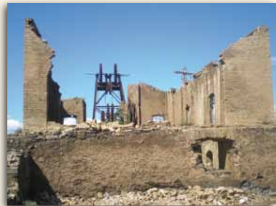
Mina La Pagana

También es destacable durante este año la incidencia de distintos incendios forestales que han afectado a casi 200 hectáreas de terreno en la Sierra Minera. El más grave de ellos afectó a un paraje montañoso