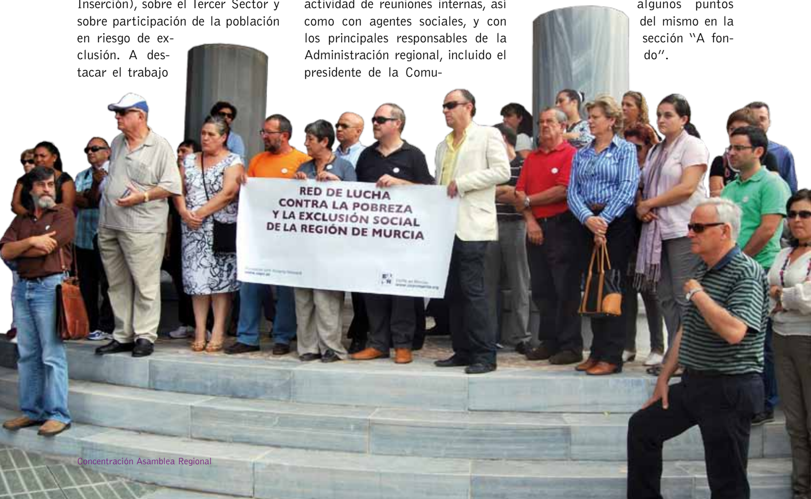
Concentración Asamblea Regional

Murcia, extractamos algunos puntos del mismo en la sección "A fondo".