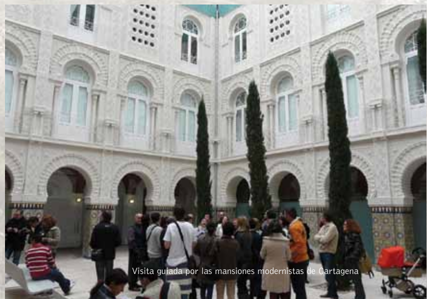
Visita guiada por las mansiones modernistas de Cartagena

Una de las visitas más interesantes que tuvimos en el centro tuvo lugar por primavera. Fue la de nuestros colegas ingleses de Cornwall, profesionales a los que avala una dilatada trayectoria en cuanto a recuperación y gestión patrimonial y que pertenecen al igual que la Fundación Sierra Minera a la red de defensa del patrimonio europeo "Europamines", con los que visitamos algunos parajes de nuestra comarca minera y que nos aportaron valiosas ideas respecto a gestión y restauración patrimonial.