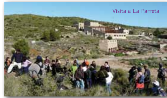
Visita a La Parreta

En cuanto a las visitas al Centro Las Matildes hemos seguido atendiendo