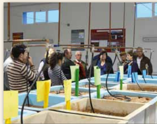
Visita al Laboratorio

Además, el 13 de diciembre el laboratorio del Proyecto Piloto abrió sus puertas a los colectivos vecinales de Portmán y Fundación Sierra