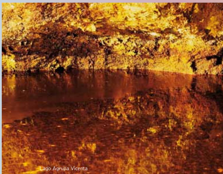
Lago Agrupa Vicenta

Otro de los elementos característicos del paisaje de este Parque Minero es la chimenea-serpentín perteneciente a la Fundición de plomo Trinidad de Rentero. Son galerías en forma de zig-zag, apoyadas en la ladera del monte, cuya finalidad era evitar que el plomo gaseoso llegara a la atmósfera en ese estado. A medida que el humo recorría el serpentín se iba enfriando, con lo que las partículas de plomo se iban condensando y solidificando pegándose en los muros. El humo salía ya frío y limpio de plomo, el cual era recuperado de las paredes de la galería. Cerca de ella aún se puede observar el "gachero", depósito de escorias o residuos de esta fundición.