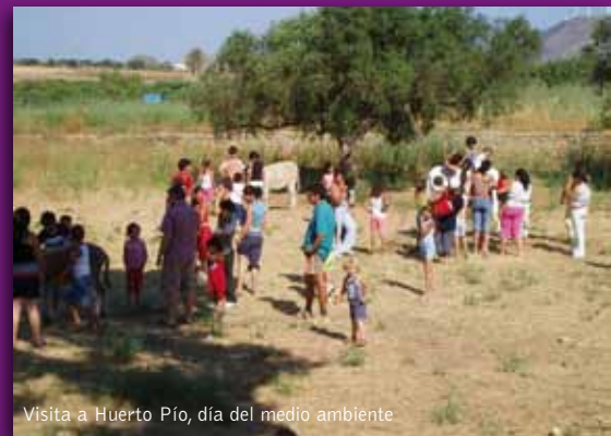
Visita a Huerto Pio, día del medio ambiente

de la CARM. Sin embargo, este año desapareció la línea de subvenciones para los proyectos de familia, y la subvención para el proyecto de infancia se redujo, suprimiéndose también ésta para el próximo año 2011, mientras que una pequeña subvención del IMAS para el proyecto de comunidad sólo se aprobó a final de año. Esto ha dificultado en gran medida el desarrollo del programa y hacía peligrar su continuidad para el 2011. Afortunadamente, el 14 de octubre se firmó un convenio entre la Fundación La Caixa y la Fundación Sierra Minera para este programa de Desarrollo Integral del Barrio San Gil, dentro de la convocatoria de ayudas a proyectos de Lucha contra la Pobreza y la Exclusión Social de la Obra Social de La Caixa, que va a permitir financiar una parte imprescindible del Programa de Desarrollo Integral del Barrio San Gil desde octubre de 2010 hasta septiembre de 2011. En la actualidad, sin la financiación de La Caixa no sería posible mantener estos proyectos esenciales para el desarrollo del barrio, en estos momentos de transición, de cambio, de esfuerzo, de mejora, en los que queda aún mucho trabajo por delante para que sus vecinos puedan desarrollarse como ciudadanos con sus deberes y derechos, con las mismas oportunidades que cualquier otra persona.