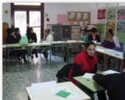
Curso habilidades sociales

✓ Proyecto de Inserción Sociolaboral con Colectivos en Riesgo de Exclusión. Este proyecto se inició el 1 de marzo de 2010 y su finalización será el 28 de febrero de 2011. Hasta diciembre de 2010 se han desarrollado itinerarios de inserción sociolaborales con 109 personas. De las cuales 25 han tenido una experiencia laboral y 38 han participado en acciones formativas. En octubre comenzó un Curso de Habilidades Sociales para el Empleo con 15 alumnos.