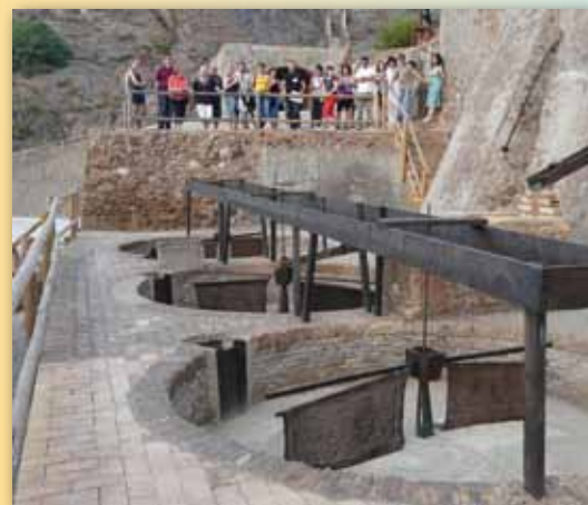
Grupo en el Lavadero Remunerada

5. Visita al Lavadero Remunerada. Además de la visita guiada, los