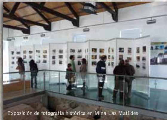
Exposición de fotografía histórica en Mina Las Matildes

El Centro de Interpretación de la Mina Las Matildes y la Fundación Sierra Minera, con el apoyo del Parque Minero de La Unión, convocaron la V Edición del Concurso de Fotografía, en esta ocasión centrado en la Fotografía Histórica en la Sierra Minera de Cartagena-La Unión. El objetivo fue recopilar y difundir antiguas imágenes que pudieran ser de interés para mostrar los distintos aspectos etnográficos, de la vida cotidiana y de la historia en nuestra Sierra.