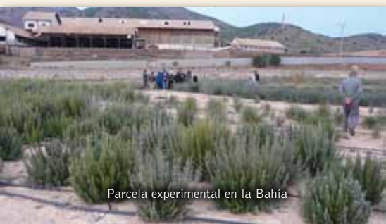
Parcela experimental en la Bahía

La no inclusión en el proyecto de presupuestos de 2011 de una partida para la regeneración de la Bahía de Portmán, mientras sí se destina una partida específica para el proyecto de construcción de un puerto de contenedores en El Gorguel, fue la gota que colmó el vaso de la paciencia de la Corporación municipal de La Unión, y que motivó el acuerdo unánime en pleno de los concejales de los tres grupos municipales presididos por el alcalde, respaldan-