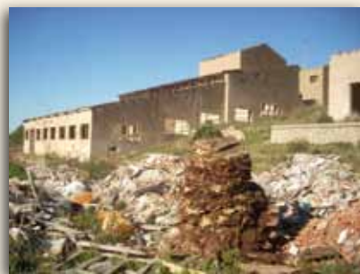
Escombros en La Parreta

El año 2010 afortunadamente no ha sido especialmente trágico para la integridad del patrimonio minero en la Sierra de Cartagena-La Unión, aunque han existido atentados puntuales que han afectado a la integridad de la maquinaria de tracción en alguna mina en el entorno del Cabezo Rajao. Sin embargo, sí que hay que lamentar la falta de medidas para impedir que se sigan deteriorando a pasos acelerados muchas instalaciones mineras, como la mina La Ocasión-El Huerto , que está pasando de ser uno de los complejos mineros mejor conservados a presentar un aspecto bastante deficiente, o como las minas La Pagana y La Paz en el entorno del Llano del Beal, que se encuentran cada vez en un estado de conservación más lamentable.