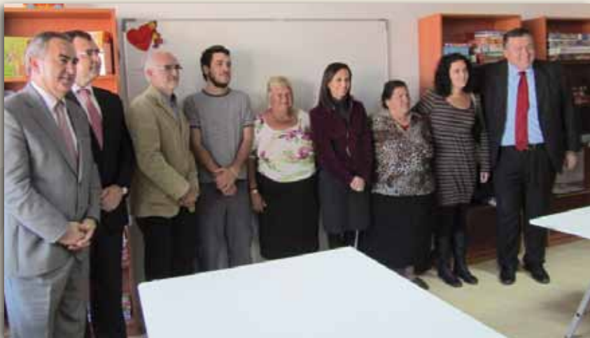
Visita Secretaria de Estado de Vivienda

e integrarlo en la trama urbana del municipio, consiguiendo una mejor conexión viaria entre las calles San Gil y Real, ampliar las zonas verdes y generar una gran parcela dotacional para equipamientos públicos.