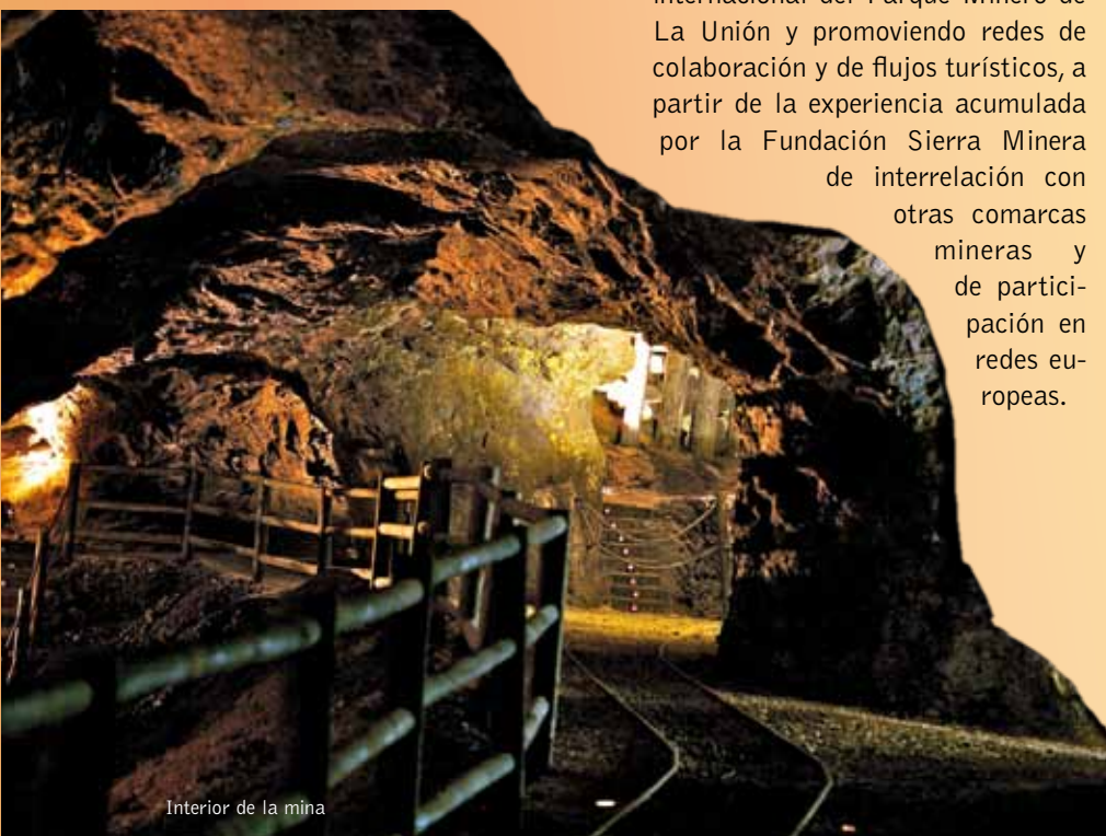
Interior de la mina

• Potenciar la proyección nacional e internacional del parque minero, ampliando la labor de promoción y potenciando las relaciones con otras experiencias de parques mineros y de minas recuperadas para el turismo a nivel europeo, asegurando la proyección a nivel nacional e internacional del Parque Minero de La Unión y promoviendo redes de colaboración y de flujos turísticos, a partir de la experiencia acumulada por la Fundación Sierra Minera de interrelación con otras comarcas mineras y de participación en redes europeas.